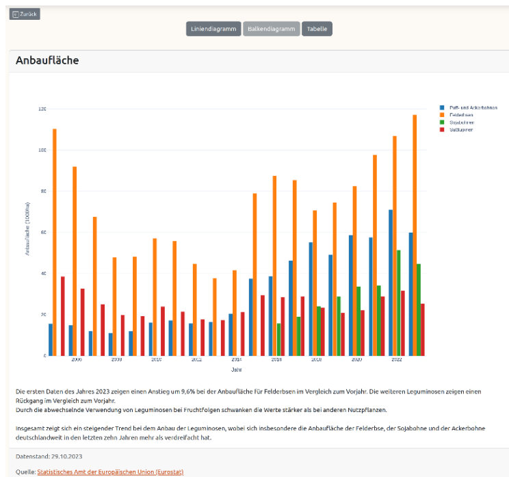
Abb. 2: Beispielhafte Darstellung einer Großansicht von Anbaufläche-Daten mit Zusatzinformationen in LeguDash

Zusätzliche Informationen und graphische Darstellungen sind unter den Diagrammen referenziert. Eine Großansicht einer beispielhaften Graphik mit Zusatzinformation ist in Abbildung 2 zu sehen. In dem obigen Reiter der Abbildung lassen sich verschiedene Darstellungsarten auswählen und sowohl Graphiken als auch Tabellen sind herunterladbar.